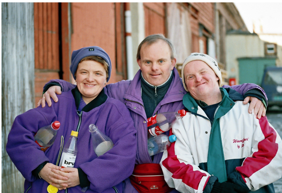
Fra Kabal i hjerter, produsert av Øyfilm As

VF skal jobbe aktivt for å fremme og tilrettelegge for kontakter innen det europeiske produksjons- og finansieringsapparatet.