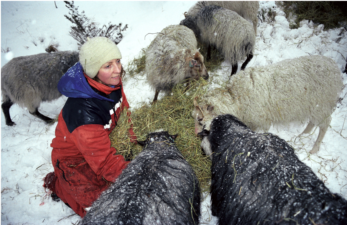
Fra Villsauen, reven og kjærligheten, produsert av Embla Film As